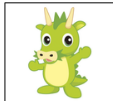
さいたま市ユルキャラ ミヌマのヌー