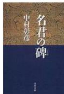
名君の碑 中村彰彦 文春文庫